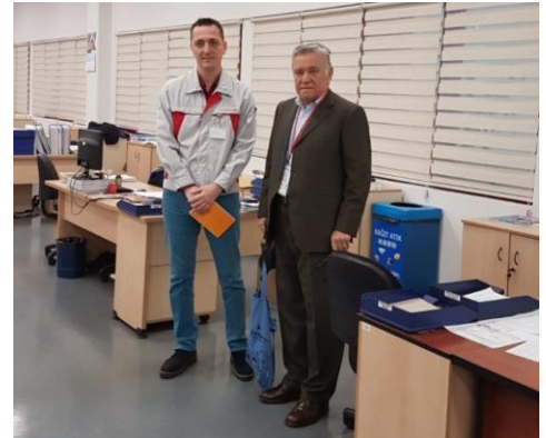
Toyotetsu - Açık ofiste şeffaf çalışma anlayışı ve yönetici çalışma alanları