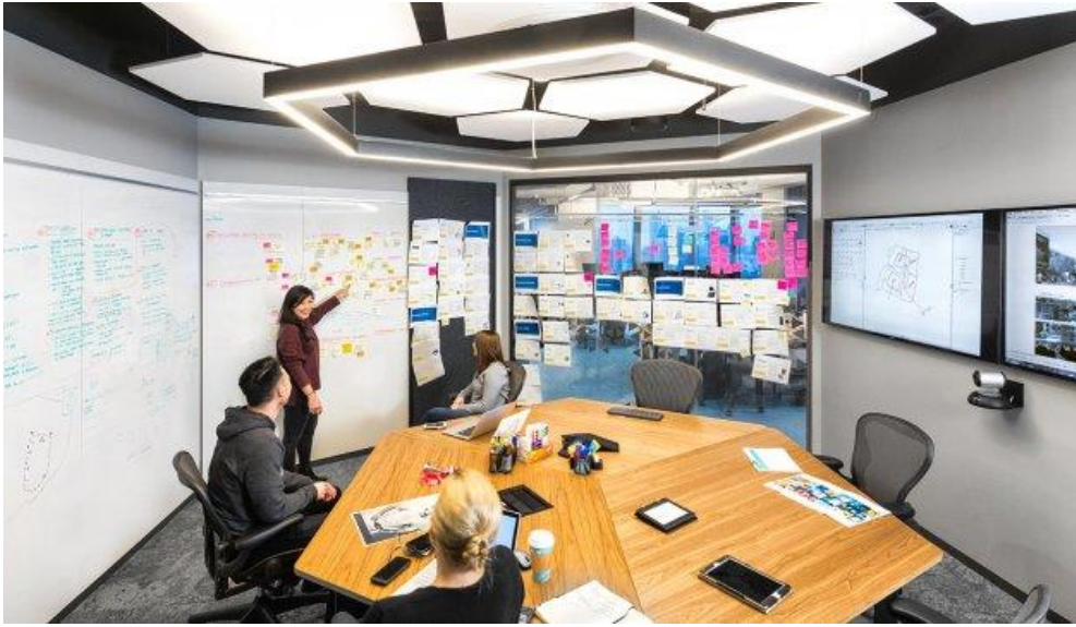
BCG Digital Ventures' New York office.