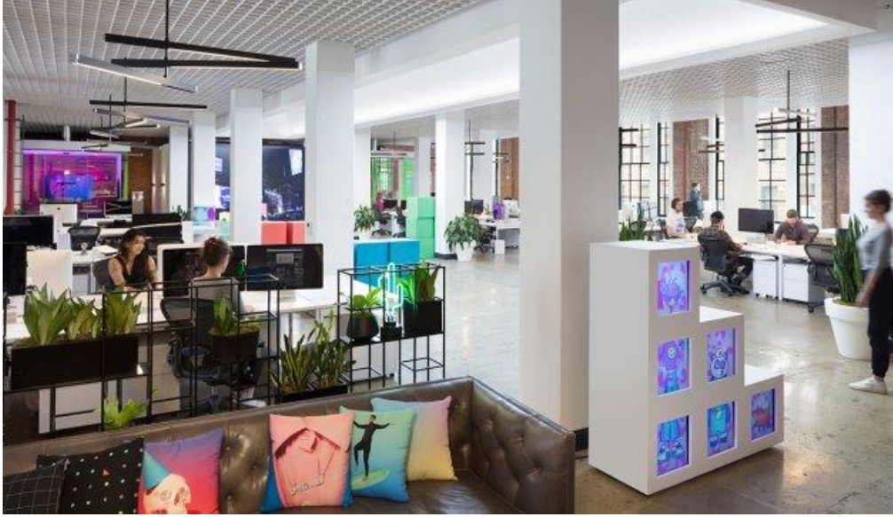
Giphy's new Manhattan office. Açık ofis ve sosyal alanlar